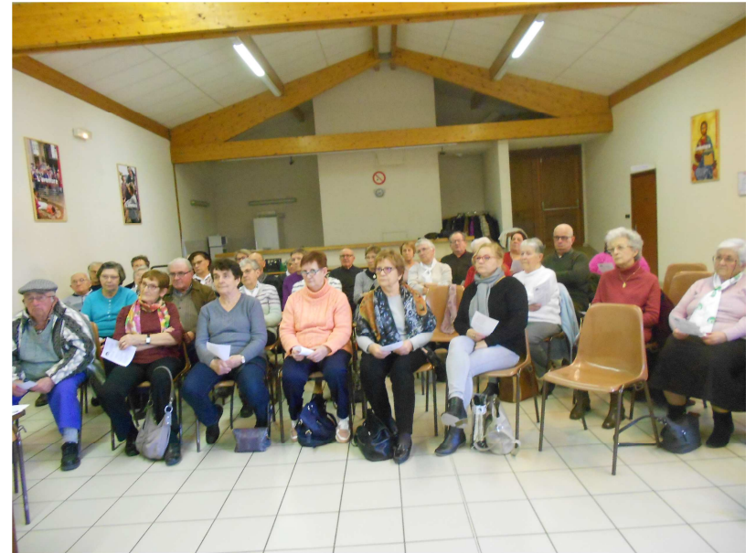
Le 23 Janvier à St Péray