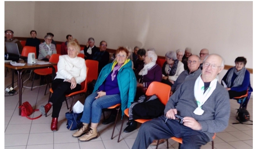
6 Mars à Aouste